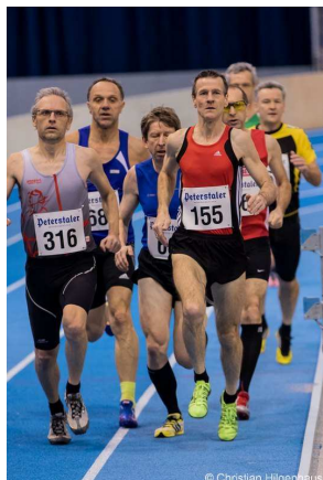
Die baden-württembergischen Senioren kämpfen bei den Titelkämpfen in Helmsheim um die Medaillen.